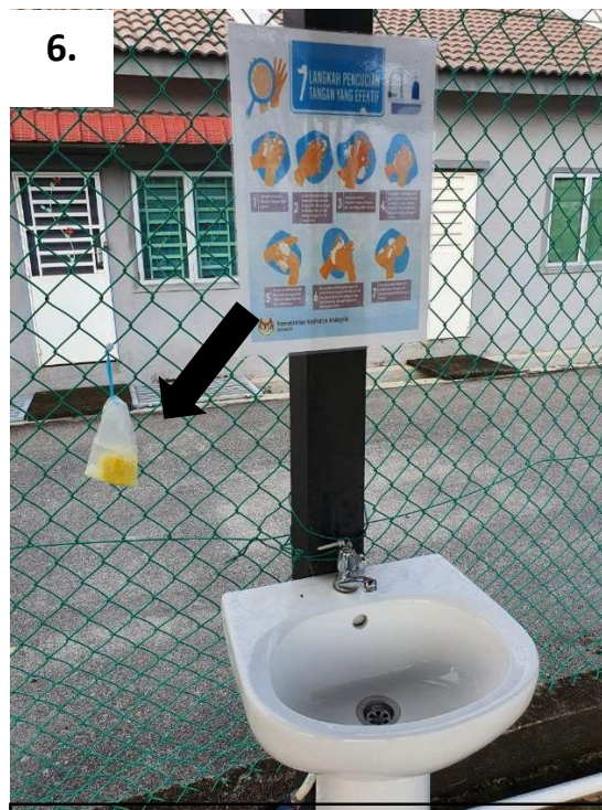
Sabun Kastory (sabun yang berwarna kuning seperti dalam gambar)