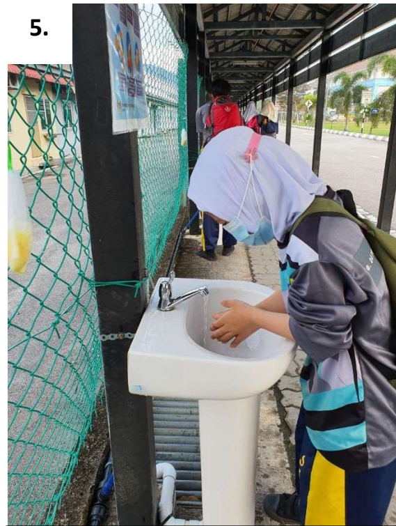
Murid melakukan proses 7 langkah mencuci tangan sebagaimana yang digariskan oleh KKM.