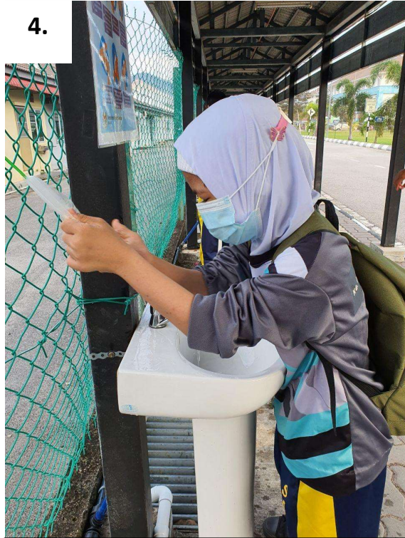
Murid menggunakan sabun Kastory yang telah digantungkan pada dawai pagar.